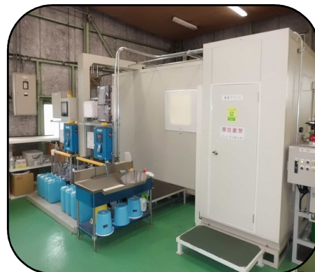
テストプラント外観