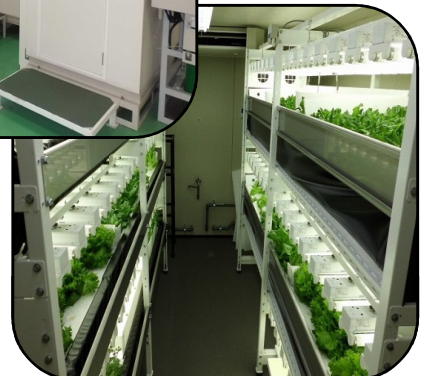
テストプラント栽培室